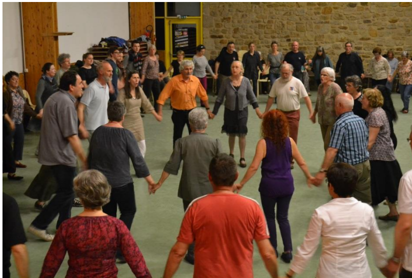
Photo : Rond de l'île de Sein mené lors d' An Diaoul a Gan , la Fête du chant organisée chaque année par Dastum Bro Gerne.

Seront présentées dans ce stage des rondes chantées en français pratiquées par les populations littorales du Golfe du Morbihan, mais aussi des ports bigoudens, de l'île de Sein, de la presqu'île guérandaise, avec une attention particulière sur les diverses formes de ronds à trois pas et les danses de cette famille pratiquées dans d'autres régions littorales de l'Ouest de la France. Des extraits de films permettront de voir des danseurs ayant appris ces danses de tradition.